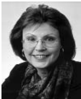
海德玛丽·维乔雷克-措伊尔 德国联邦经济合作发展部部长

此外,《千年宣言》还让我们认识到,消除贫困必须采取全面、综合的方法。促进性别平等、与艾滋病作斗争、缔结全球发展伙伴关系等都是十分关键的问题,其本身即被视为目标。而且在旨在实现《千年发展目标》的各项行动中,均应关注这些问题。艾滋病的蔓延严重威胁到所有其它目标的实现。如果不能形成坚定的发展伙伴关系,支持实现所有的《千年发展目标》,那么,国家层面的努力很可能是徒劳的。正如本书所详细阐述的,性别不平等与《千年发展目标》所致力于应对的每一项发展挑战均有着千丝万缕的联系。