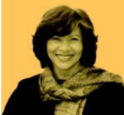
诺琳·黑泽 联合国妇女发展基金执行主任

千年宣言和《千年发展目标》(MDGs)为促进两性平等开启了一扇崭新的大门。如果这两个文件能够得到充分利用,人们可以由此深刻地认识到并消除那些在性别不平等、对女性潜力的浪费与摧残、以及看似无穷无尽的贫困之间的恶性关联。正如《千年宣言》提到的,要切实有效地消除贫困,取决于我们是否愿意面对这样一个事实:占世界人口一半的女童和妇女在整体上仍处于从属地位和不利境地。这要求我们坚定不移地采取具体措施来消除性别不平等。